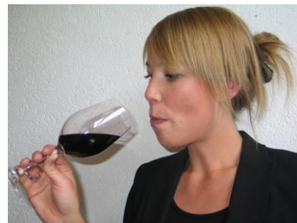
Im Gaumen, beim Abgang, wirkt der Wein nach.