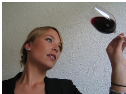
Das Auge prüft die Farbe und die Klarheit des Weines.