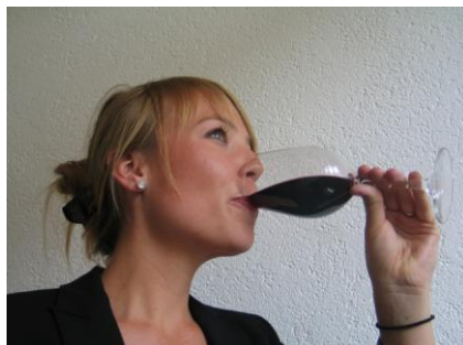
Im Mund kommt der Geschmack zur Geltung.