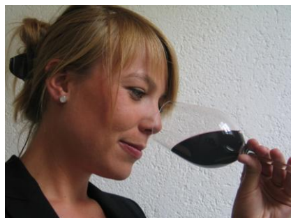
Die Nase beurteilt die Aromen.