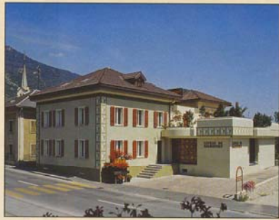
Das Weinhaus Gregor Kuonen in Salgesch.