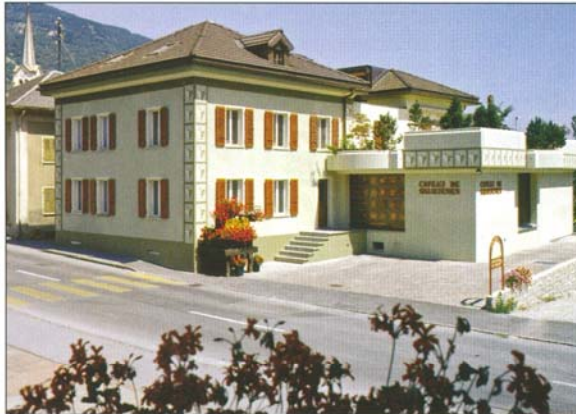
Caveau de Salquenen

Die Weinkellerei GREGOR KUONEN blickt auf eine lange Tradition im Weinbau zurück. Die langjährigen Erfahrungen in der Vinifikation von Spitzenweinen erlaubt es der Familie Kuonen Ihren Kunden nur Weine erster Qualität anzubieten. Das Weinhaus GREGOR KUONEN produziert gegen vierzig unterschiedliche Weine, darunter acht Pinot Noirs. Hier finden Weinliebhaber verschiedene autochthone Weinsorten, wie der Lafnetscha, Heida, Diolinoir, Cornalin, Humagne Rouge... Hauptanliegen der Familie Kuonen ist es, ihrer Klientel ein breites Segment qualitativ hoch stehender Weine zu präsentieren. So werden auch zahlreiche Spezialitäten und Assemblage kreiert. Die Linien „Grandmaitre“ und „Vieux Salquenen“ vereinen die besten Crus des Hauses. An die hundert Auszeichnungen an bekannten nationalen und internationalen Weinwettbewerben zieren die Ehrentafel des Familienbetriebs. Am ersten Grand Prix du Vin Suisse – dem bisher prestigeträchtigsten Quervergleich von